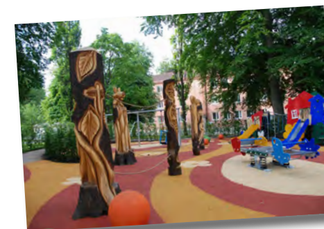
Skulpturer och lek kombineras