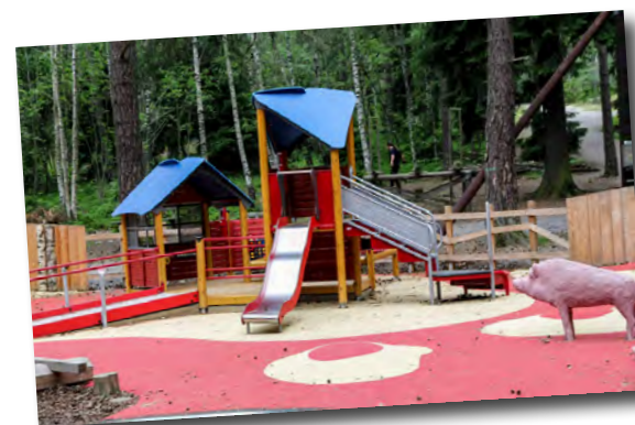
Här kan fler leka!

Tillgänglighet handlar även om avståndet från bostaden, säkerheten på gång- och cykelvägar som leder till lekplatsen samt huruvida barnen kan röra sig utan att korsa någon större trafikled eller annan barriär. Om parker och lekplatser ska användas och uppskattas är det avgörande var de finns och hur vägen dit ter sig. Vid både upprustning, utveckling och nybyggnation bör därför åtgärder vidtas för att förbättra tillgängligheten och motverka barriäreffekter, allt för att barnen ska kunna ta sig till och från lekplatsen på egen hand.