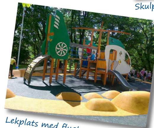
Lekplats med flygtema